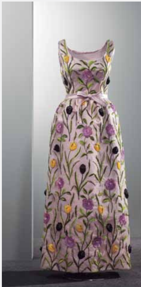
BALENCIAGA Paris, 1960.

Tunika-soinekua, zetazko satin beltzez egina, ezkata distiratsuekin eta beira-pastazko alezko apaingarriekin brodatutako tul mekanikoa duena.