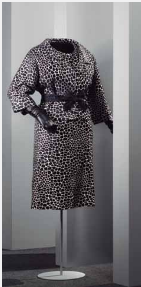
EISA Donostia, 1959.

Koktel-konjuntua, kolore zuriko eta beltzeko damasko-erako soinekoa eta jaka dituen.