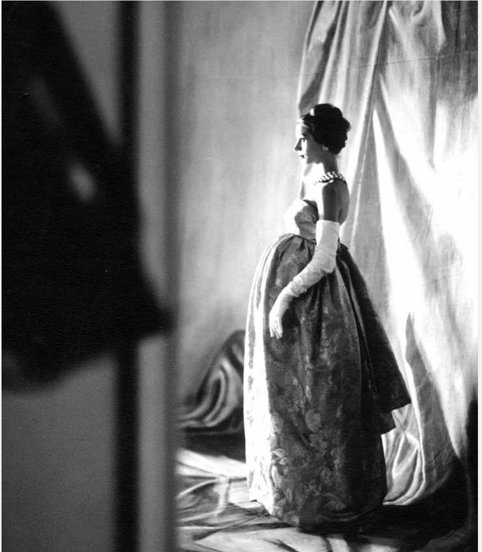
GAUEKO SOINEKOA, 1960. Balenciaga artxiboak, Paris.