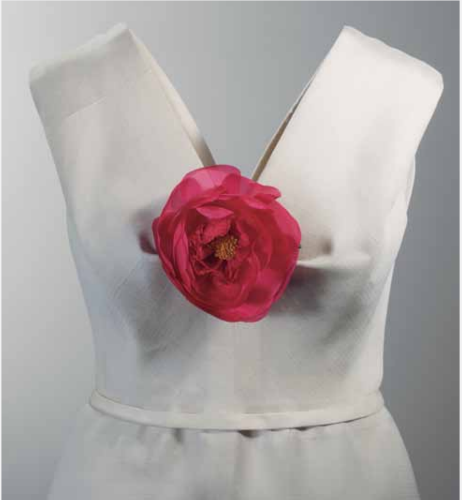
BALENCIAGA Paris, 1966.

Gaueko soinekoa, artile-koloreko gazarrez egina. Gorputza zeharka moztuta dago, eta V-itxurako eskotea du aurrealdean nahiz bizkaraldean. Drapeatuak bolumena ematen dio lore baten bidez errematatutako aurrealdeko eskoteari, eta begizta batek are gehiago nabarmentzen du bizkaraldeko eskotea. Gona lurreraino erortzen da, dindirri txiki bat sortuz.