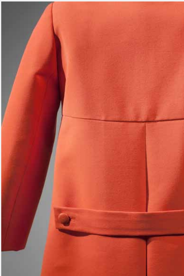
EISA Madril, 1964.

Eguneko beroki zuzena, rayonezko zirrikitun laranjaz egina, eskote biribildua eta lepo itsatsia dituena. Botoi-ilara bikoitzeko aurrealdeko itxitura eta bularraren azpiko ebakidura garbia dira berokiaren bereizgarri nagusiak. Bertikalki erortzen diren aurrealdeko josturek estali egiten dituzte poltsikoak.