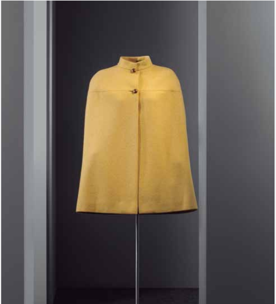
BALENCIAGA Paris, 1967.

Artilezko kapa horia, zerrenda-lepoa eta aurrealdea nahiz bizkaraldea zeharkatzen dituen kanezua dituena. Lepoaren parean eta kanezuaren ebakiduran jarritako bi botoiren bidez ixten da.