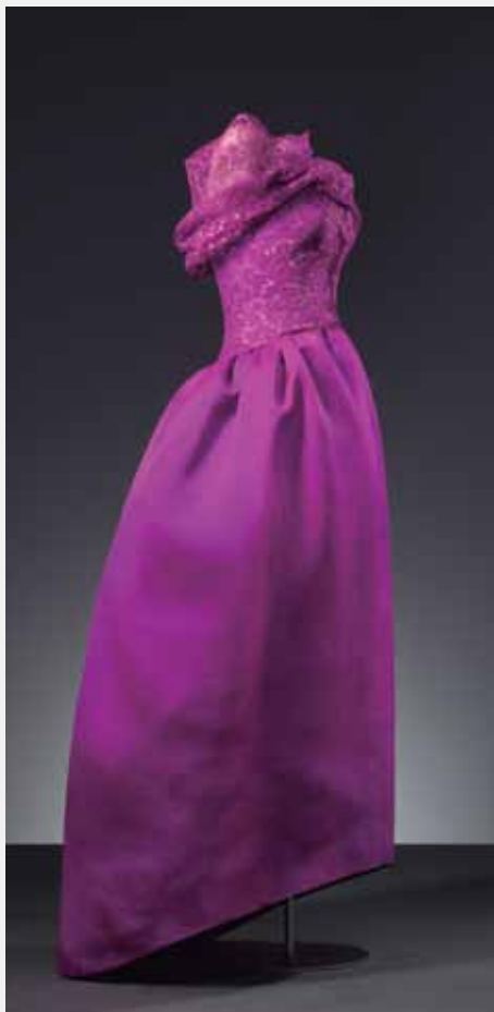
BALENCIAGA Paris, 1958.

Koktel-konjuntua, kolore zuriko eta beltzeko damasko-erako soinekoa eta jaka dituen.