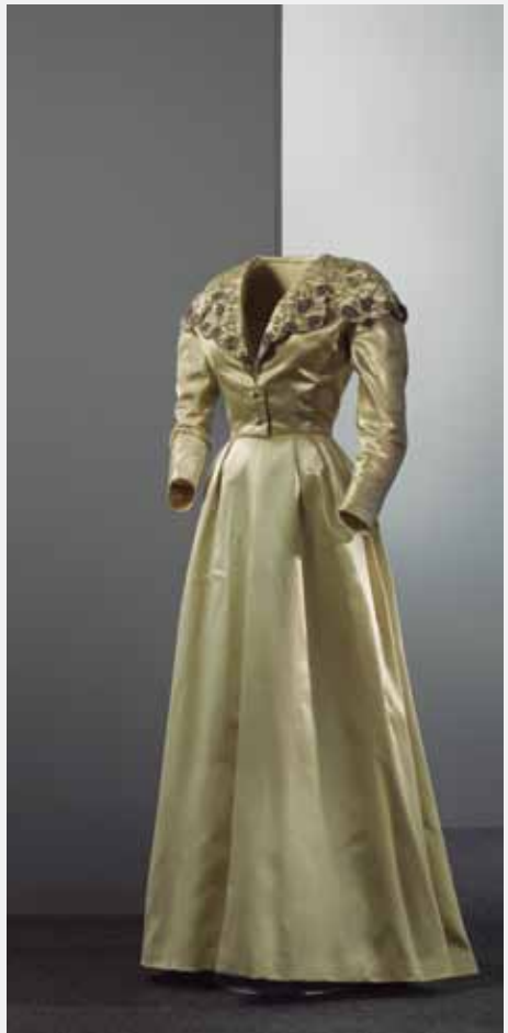
BALENCIAGA Paris, 1939.

Gaueko soinekoa, zetazko otoman zuriz egina, kordoi-aplikazio urdin iluna duena. Begizta bat balitz bezala luzatzen den xingola bat du lepo-zerrendan, itxitura kremaileraduna aurrealdean, eta mahuka izurduak. Aurrealdean, soinekoaren gorputza bertikalki zeharkatzen duen kordoizko apaingarria nabarmentzen da, bularraren parean biribilkatzen dena. Balenciagak Elsa Schiaparelli adiskidea omendu zuen modelo honen bitartez; surrealismoak modan izandako eraginaren adierazle nagusia, alegia.