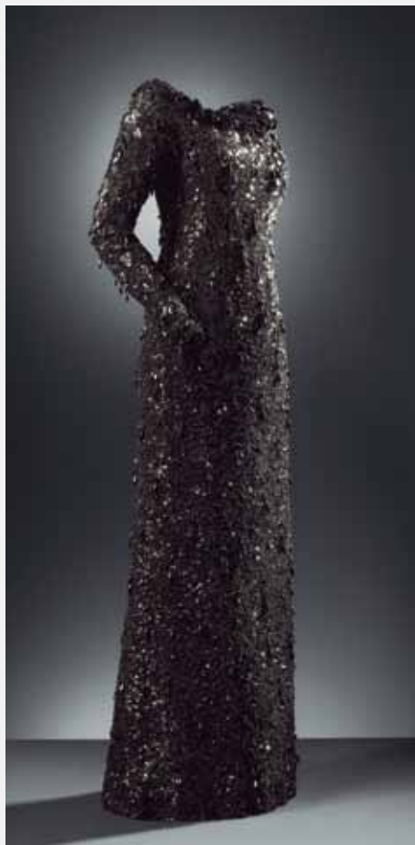
EISA Madril, 1964.

Tunika-soinekua, zetazko satin beltzez egina, ezkata distiratsuekin eta beira-pastazko alezko apaingarriekin brodatutako tul mekanikoa duena.