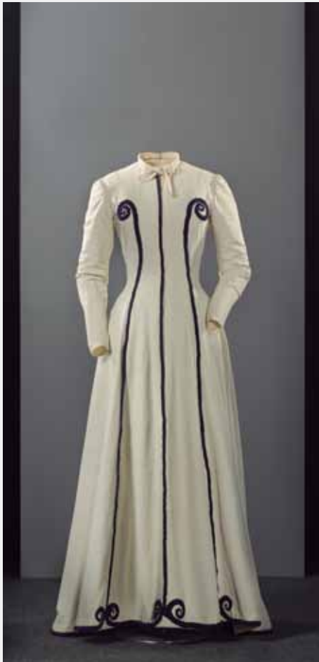
BALENCIAGA Paris, 1939.

Gaueko soinekoa, zetazko otoman zuriz egina, kordoi-aplikazio urdin iluna duena. Begizta bat balitz bezala luzatzen den xingola bat du lepo-zerrendan, itxitura kremaileraduna aurrealdean, eta mahuka izurduak. Aurrealdean, soinekoaren gorputza bertikalki zeharkatzen duen kordoizko apaingarria nabarmentzen da, bularraren parean biribilkatzen dena. Balenciagak Elsa Schiaparelli adiskidea omendu zuen modelo honen bitartez; surrealismoak modan izandako eraginaren adierazle nagusia, alegia.