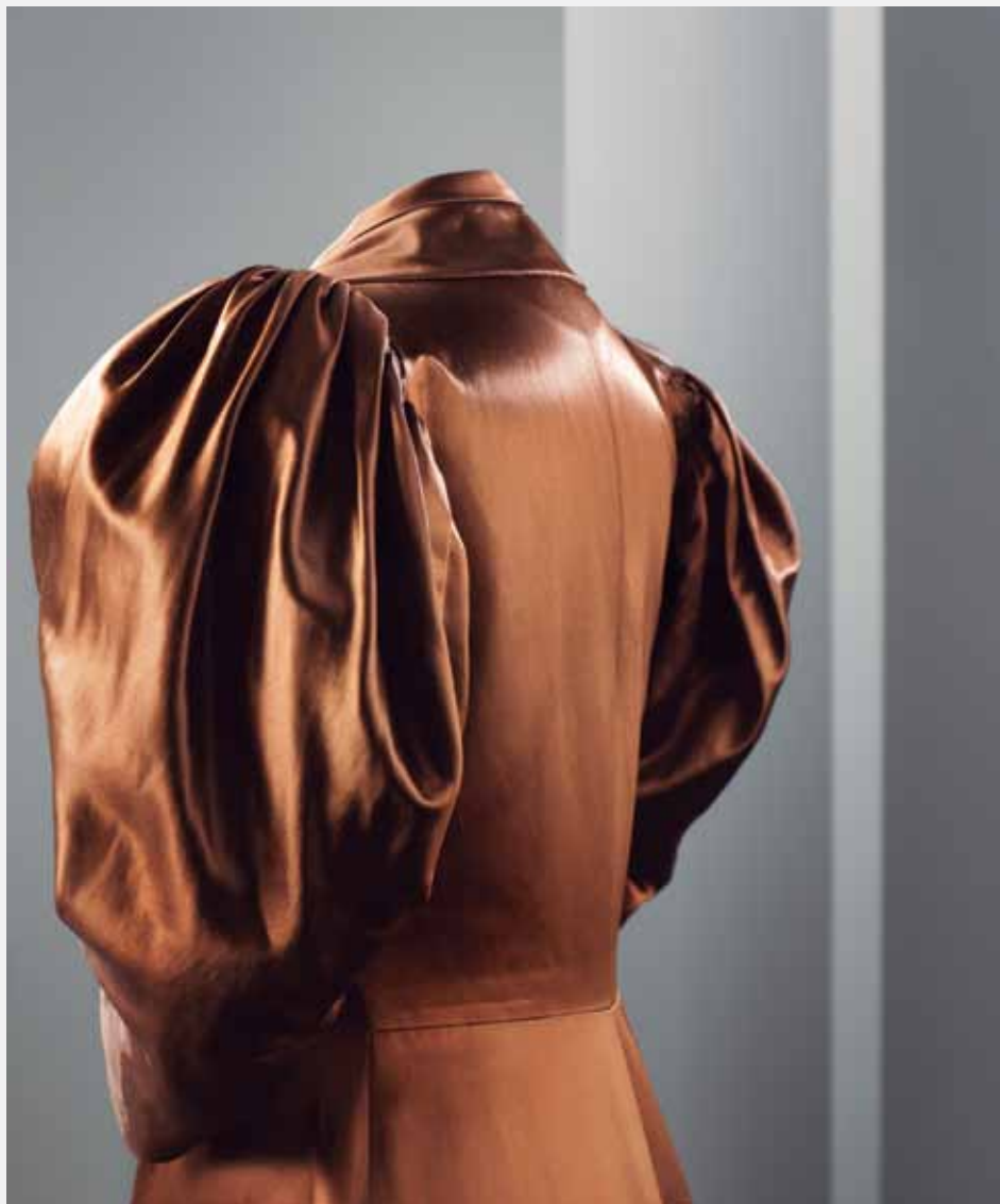
BALENCIAGA Paris, 1938.

Gaueko déshabillé arrea, zetazko satinez egina. Papar-hegal handiko lepoa eta «urdaiazpiko»-iturako mauka harroak ditu, eta ehun berarekin forratutako botoien bidez ixten da aurrealdean. Balenciagak, modelo honen bitartez, emakumeek xix. mendean zaldi gainean ibiltzeko erabiltzen zuten jantziaren interpretazio fina egin zuen.