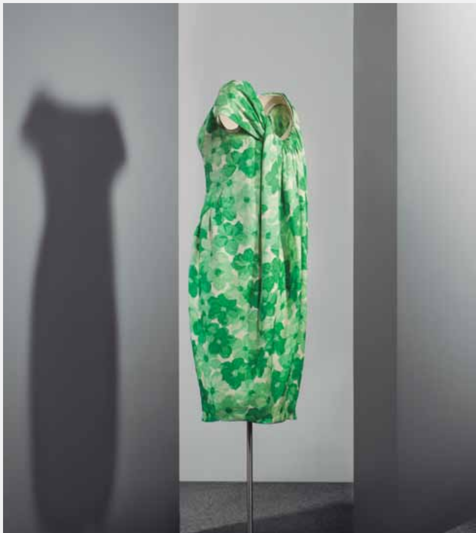
EISA Madril, 1961.

Koktel-soinekoa, zeta basati zuriz egina, tonu berde desberdinetako lore-estapatua duena. Soinekoaren aurrealdean, gerriko ebakidura gailentzen da, zuzena aurrealdean eta makurra bi aldeetan. Eskote nabarmena du, itsasontzi-formakoa. Atzealdean, bolumen handiko drapeatu bat abiatzen da, soinekoaren protagonismoa hartzen duena.