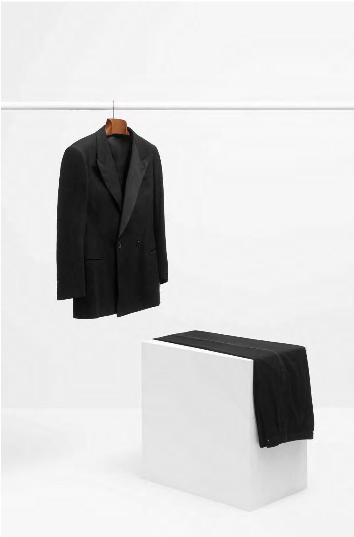
CBM 2000.128ab Artile urdin ilunez egindako esmokina. Paris, 1939