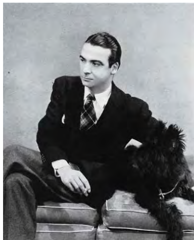
Cristóbal Balenciagaren erretratua