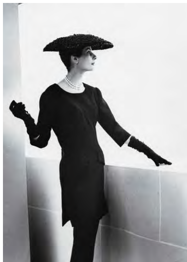
Cristóbal Balenciagaren sorkuntza lanen ondarearen bi lagin: «tunika» eta «midi» © Nordin/Nilson, Archives of the Nordic Museum © Cristóbal Balenciaga Fundazioa

Erakusketaren diskurtsoa 1968an amaitzen da, moda etxea itxi zen urtean, eta orobat egiten dio erreferentzia Balenciaga bizi zela nahiz hura hil ondoren haren obra ondaretzeko gertatutako prozesuari.