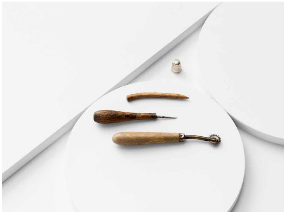
CBM 2000.155-158 Lanerako tresnak (metalezko puntzoia, zurezko puntzoia, erruleta eta titarea)