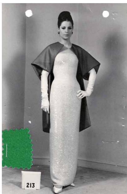
Argazkia ehun laginarekin. 60. hamarkada

Jostuna Getarian hil zen, 1972an, eta, harrezkero, zenbait enpresa talderen eskuetan egon zen Balenciaga etxea, harik eta Kering taldean sartu zen arte (talde horren parte da gaur egun). Gaur egungo modako garrantzi handiko irudiak aritu dira marka horretan sorkuntza zuzendari: Nicolas Ghesquière, Alexander Wang eta, gaur egun, Demna Gvasalia. Cristóbal jaio zenetik 125 urtera, haren moda etxea itxi eta 52 urtera, goi mailako jostuntzara itzuliko dela iragarri du Balenciaga etxeak.