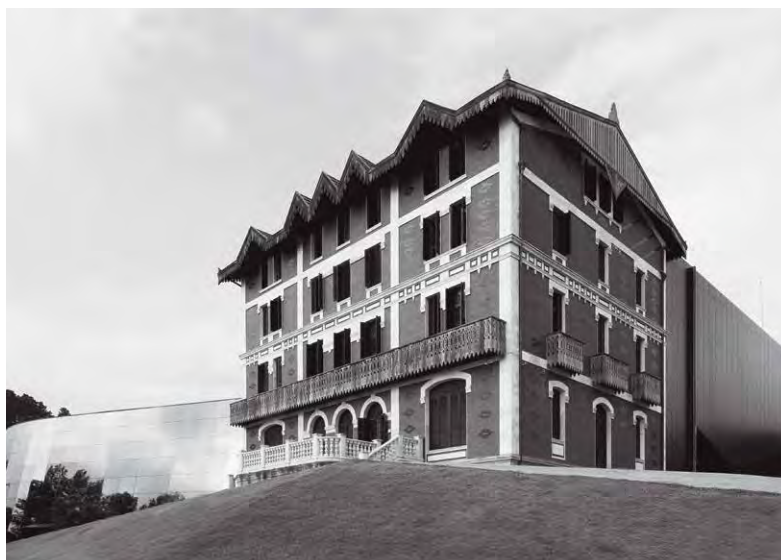
Cristóbal Balenciaga Museoa, Getarian

Cristóbal Balenciaga museoak 2011. urteko ekainaren 7an zabaldu zituen ateak. Jostunaren jaioterrian dago kokatua, Cristóbal Balenciagaren lehenengo prestakuntza-urteen eta heldutasun profesionalaren oroimenez eta modaren munduari egindako ekarpenak ulertzeko helburuarekin.