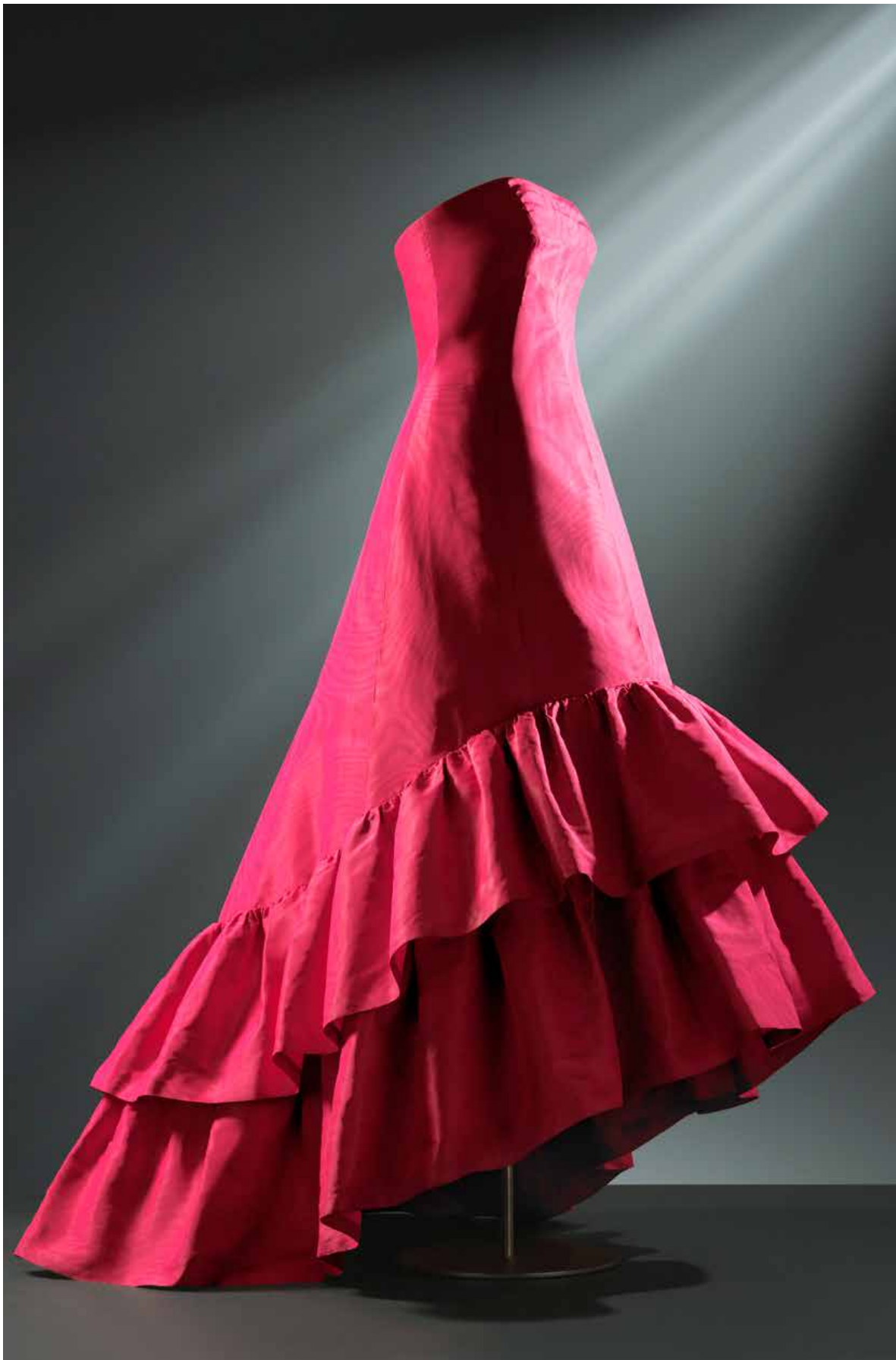
CBM 02.1999 Tafeta distiratsu fuksiaz egindako gaueko soinekoa, bi bolanterekin, 1963 © Cristóbal Balenciaga Fundazioa / Estudio Outumuro