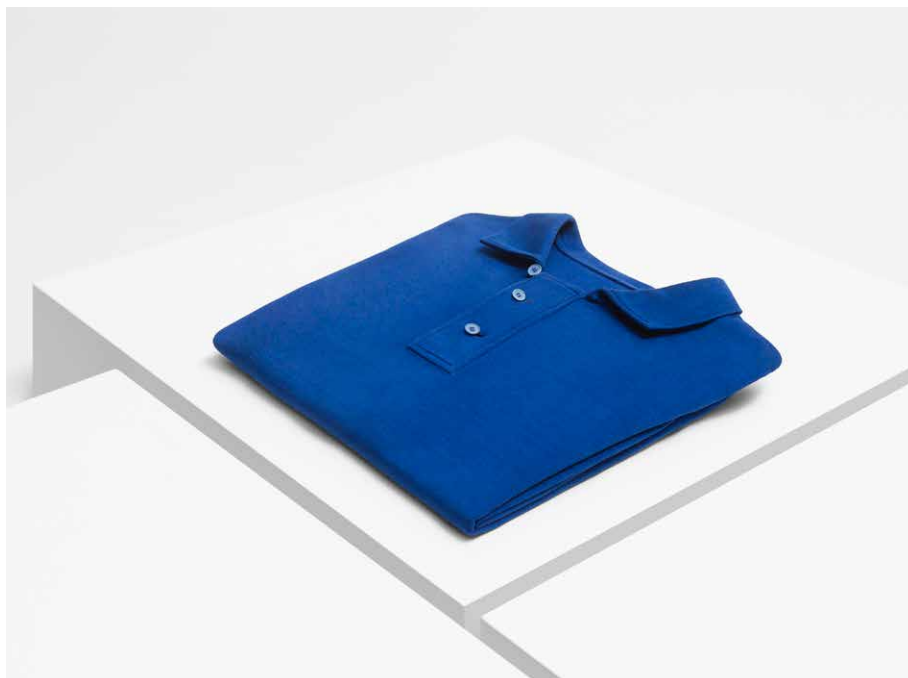
CBM 2000.93 Klein urdin koloreko puntuzko poloa, Cristóbal Balenciagarena

Museoaren bildumek Cristóbal Balenciagak sortutako obrak biltzen dituzte, baina baita haren jabetzako hainbat objektu ere, oso lagungarriak Balenciagaren testuinguru biografikoa, kulturala eta lan arlokoa ezagutzeko. Jostunaren hurbileneko kideek –senideek, lankideek, enplegatuek, lagunak– objektu horiek kontserbatu, eta Museoari dohaintzan eman edo laga dizkiote, erabateko eskuzabaltasunez, orain erakusgai jar ditzan.