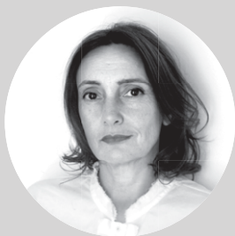
AMY DE LA HAYE

Komisariotzako eta Janzkiaren Historiako irakaslea da eta Zuzendariondokoa University of the Arts London Centreko London College of Fashionen baitako Centre for Fashion Curationen. Moda eta janzkien erakusketetan komisario lanak egin izan ditu estatu eta eskualde mailako esparruetan eta moda-banaketako espazioetan. Horrez gain, Judith Clarkekin batera osatu zuten Exhibiting Fashion: Before & After 1971 (Yale, 2010). Hark argitaratutako lanek artxiboen eta objektuen inguruko kontaktak eskaintzen dituzte, eta bizitako bizitzen testuinguruan aztertzen dituzte objektuak. 1991tik 1999ra xx. mendeko janzkien kontserbatzailea izan zen V&A museoan.