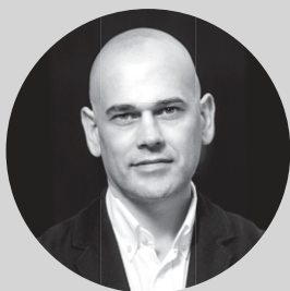
IGOR URÍA ZUBIZARRETA

Komisariotzako eta Janzkiaren Historiako irakaslea da eta Zuzendariondokoa University of the Arts London Centreko London College of Fashionen baitako Centre for Fashion Curationen. Moda eta janzkien erakusketetan komisario lanak egin izan ditu estatu eta eskualde mailako esparruetan eta moda-banaketako espazioetan. Horrez gain, Judith Clarkekin batera osatu zuten Exhibiting Fashion: Before & After 1971 (Yale, 2010). Hark argitaratutako lanek artxiboen eta objektuen inguruko kontaktak eskaintzen dituzte, eta bizitako bizitzen testuinguruan aztertzen dituzte objektuak. 1991tik 1999ra xx. mendeko janzkien kontserbatzailea izan zen V&A museoan.