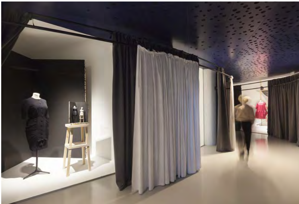
Cristóbal Balenciaga, Moda eta Ondarea.

Horien ondoan, beste baliabide batzuk: dokumentazioa, lekukotasunak, irudiak, objektuak, patrioiak, janzteko erreplikak, zirriborroak, ehunak, haren bizitza- eta lanbide-ingurunearekin harremanetan jartzen gaituztenak. Teknologia ere agertzen da erakusketa honetan, digitalizazioen bidez interaktibitatea errazteko, aukera ematen baitigu pieza baten xehetasuna ikusteko (megapixela), 360°-ko ikuspegia izateko, haren eraikuntza teknikoko infografiak lortzeko eta, app baten bidez, gaikako hainbat ibilbide egiteko.