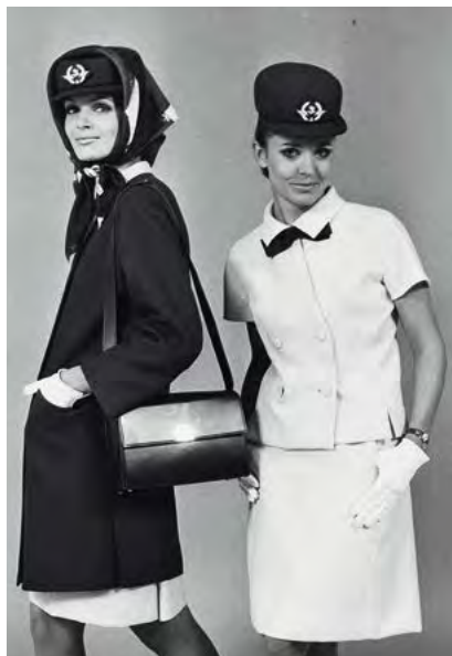
Air franceko hegazki-laguntzaileentzako uniformea, 1968.

Balenciagak "jardunean" jarraitu zuen erretiroan, bere lagunak eta ezagunak prêt-à-porter proiektu batzuetan aholkua eta laguntza emanaz, hain zuzen, Villabonako Subijana y Cía (Gipuzkoa) eta Tarazonako Textil (Zaragoza) enpresetan. 1971n, Züricheko Bellerive Museoak atzera begirako lehen erakusketa eskaini zion Balenciagari, eta, haren ondotik, asko izan dira gaurdaino.