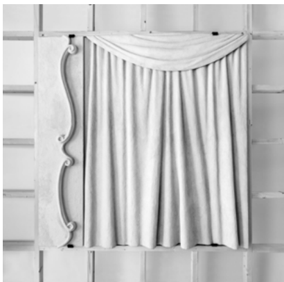
Judith Clarke Balenciaga Etxearen aretoa aipatzen du.