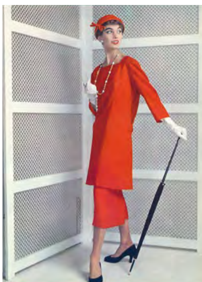
Cristóbal Balenciagaren sorkuntza-lanen ondarearen bi lagin: «midi» eta «tunika».

Bere garaiko moda-kazetarien arabera, Balenciaga izan zen «etorkizuneko modaren bidea ireki zuen jostuna», eta, hain justu ere, bere lana apurka, isilean eta etenik gabe garatuz, ideal femeninoa aldarazi zuen, modu berritzailean, bere bezeroen begietara.