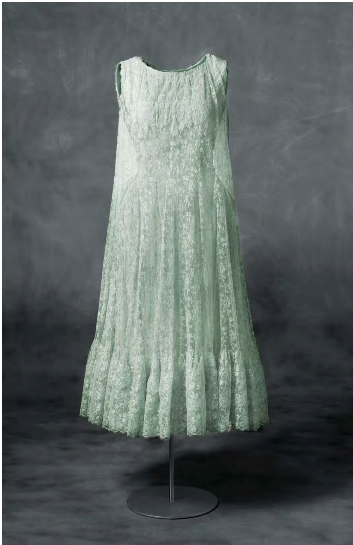
Koktel-soinekoa, zeta urdinezko tafetaz egina, zeta urdinezko parpailazko gune gardenekin. 1957. CBM 2000.51