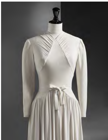
Boli-koloreko krepezko ezkontza-soinekoa, gorputz estuarekin eta aurrean begizta bat duen gerrikoarekin 1939. CBM 2012.06