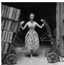
Oriol Maspons (1928-2015) Bartzelona, 1956 VSanta Eulaliaren soinekoa Zilar-gelatina paper barituan, 2012ko inprimaketa 40,7 x 40,7 cm Dohaintza: Oriol Maspons, 2015 MTIB 3.895/15