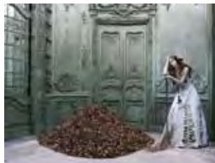
Eugenio Recuenco (1968) La cenicienta , 2005 Giclée kotoizko Ultra Smooth Fine Art paperean, 2012ko inprimaketa 43,2 x 56,5 cm Dohaintza: Eugenio Recuenco, 2015 MTIB 5.879/15