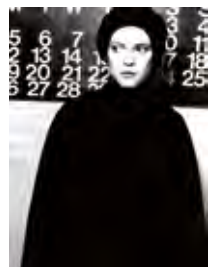
Antoni Bernad (1944) Bartzelona, 1968 Lambda paper barituan, 2012ko inprimaketa 94,4 x 70,3 cm Dohaintza: Antoni Bernad, 2012 MTIB 3.856/12