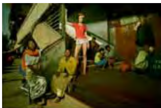
Enric Galceran (1973) Bali, 2006 Giclée Fine Art Baryta paperean, 2015ko inprimaketa 77 x 105,2 cm Dohaintza: Enric Galceran, 2015 MTIB 4.045/13