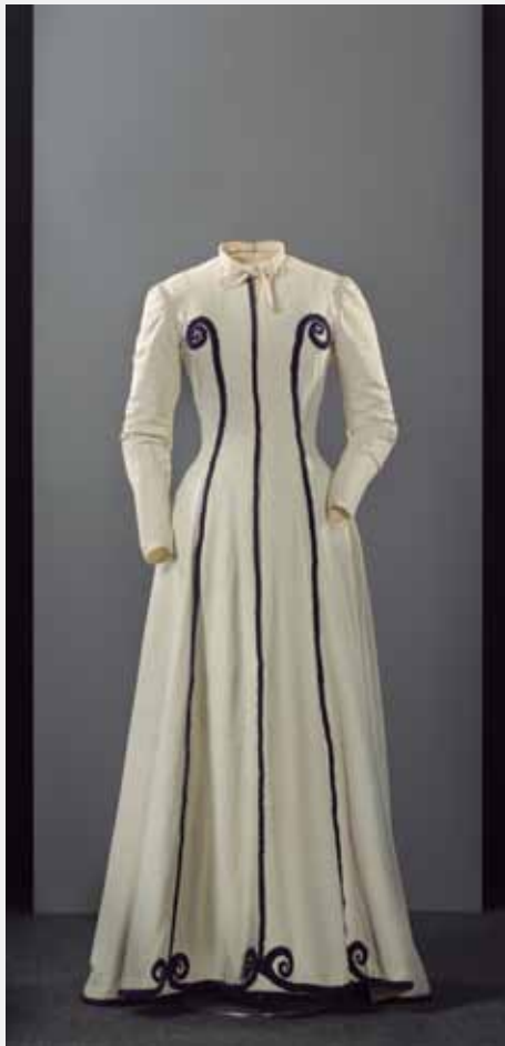
BALENCIAGA Paris, 1939.

Gaueko soinekoa, zetazko otoman zuriz egina, kordoi-aplikazio urdin iluna duena. Begizta bat balitz bezala luzatzen den xingola bat du lepo-zerrendan, itxitura kremaileraduna aurrealdean, eta mahuka izurduak. Aurrealdean, soinekoaren gorputza bertikalki zeharkatzen duen kordoizko apaingarria nabarmentzen da, bularraren parean biribilkatzen dena. Balenciagak Elsa Schiaparelli adiskidea omendu zuen modelo honen bitartez; surrealismoak modan izandako eraginaren adierazle nagusia, alegia.