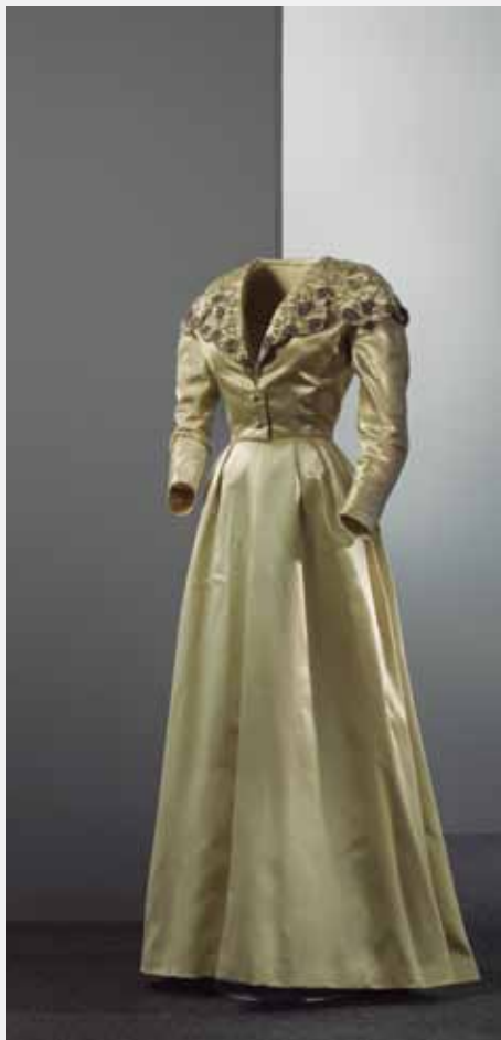
BALENCIAGA Paris, 1939.

Gaueko soinekoa, zetazko otoman zuriz egina, kordoi-aplikazio urdin iluna duena. Begizta bat balitz bezala luzatzen den xingola bat du lepo-zerrendan, itxitura kremaileraduna aurrealdean, eta mahuka izurduak. Aurrealdean, soinekoaren gorputza bertikalki zeharkatzen duen kordoizko apaingarria nabarmentzen da, bularraren parean biribilkatzen dena. Balenciagak Elsa Schiaparelli adiskidea omendu zuen modelo honen bitartez; surrealismoak modan izandako eraginaren adierazle nagusia, alegia.