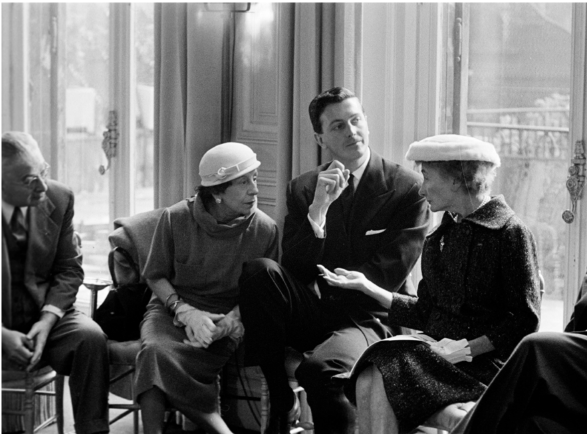
Hubert de Givenchy en train de présenter sa collection, en novembre 1955 devant les rédactrices de mode Carmel Snow et Marie-Louise Bousquet

Leurs pages dans les magazines Vogue, Harper's Bazaar et Femme Chic, entre autres, ne se limitaient pas à documenter les transformations de la silhouette féminine ; elles contribuaient activement à construire l'image publique des deux couturiers et à consolider le concept de la « famille Givenchiaga ».