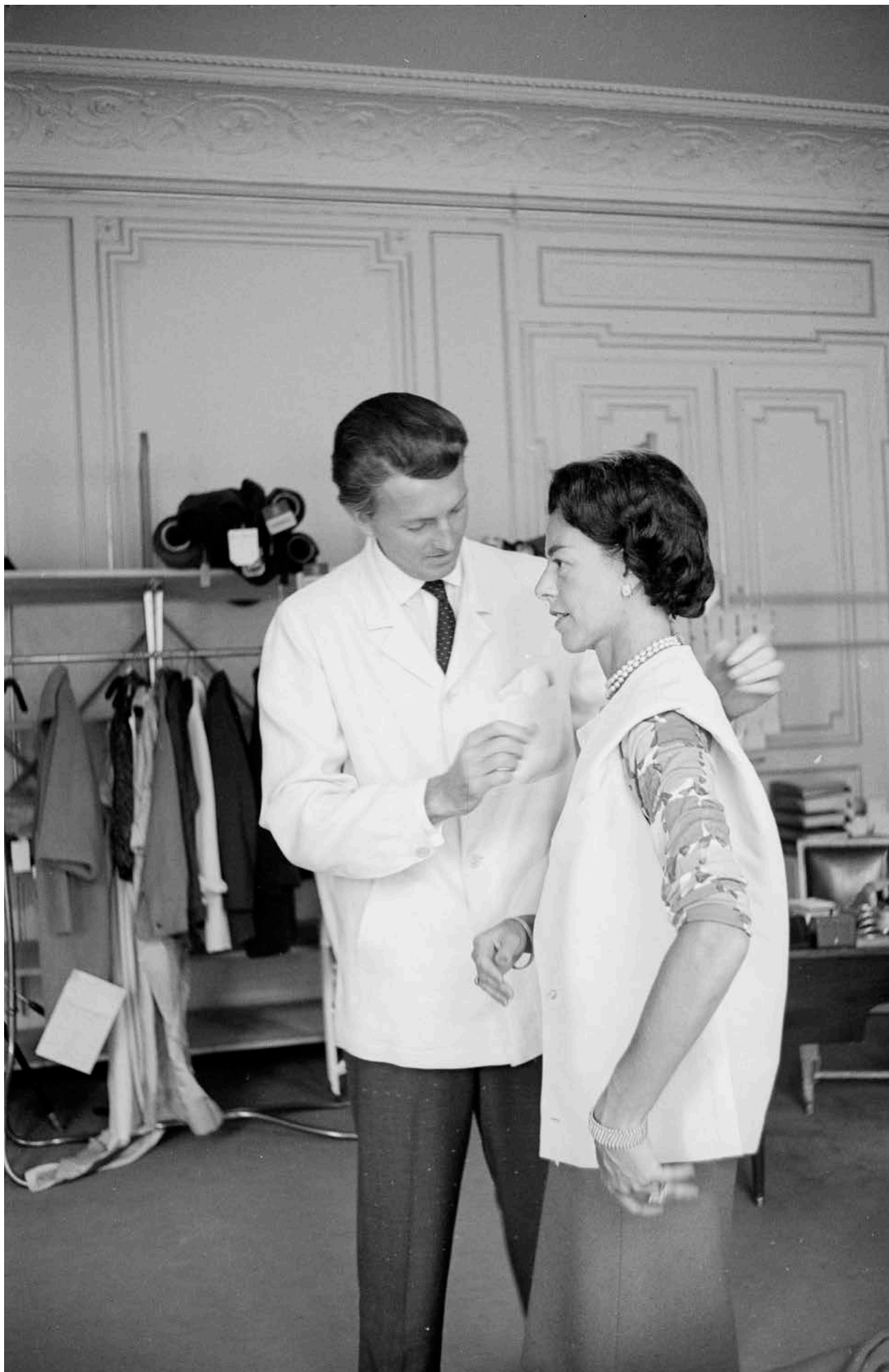
Hubert de Givenchy en séance d'essayage dans les salons du 3, Avenue Georges-V, 1961