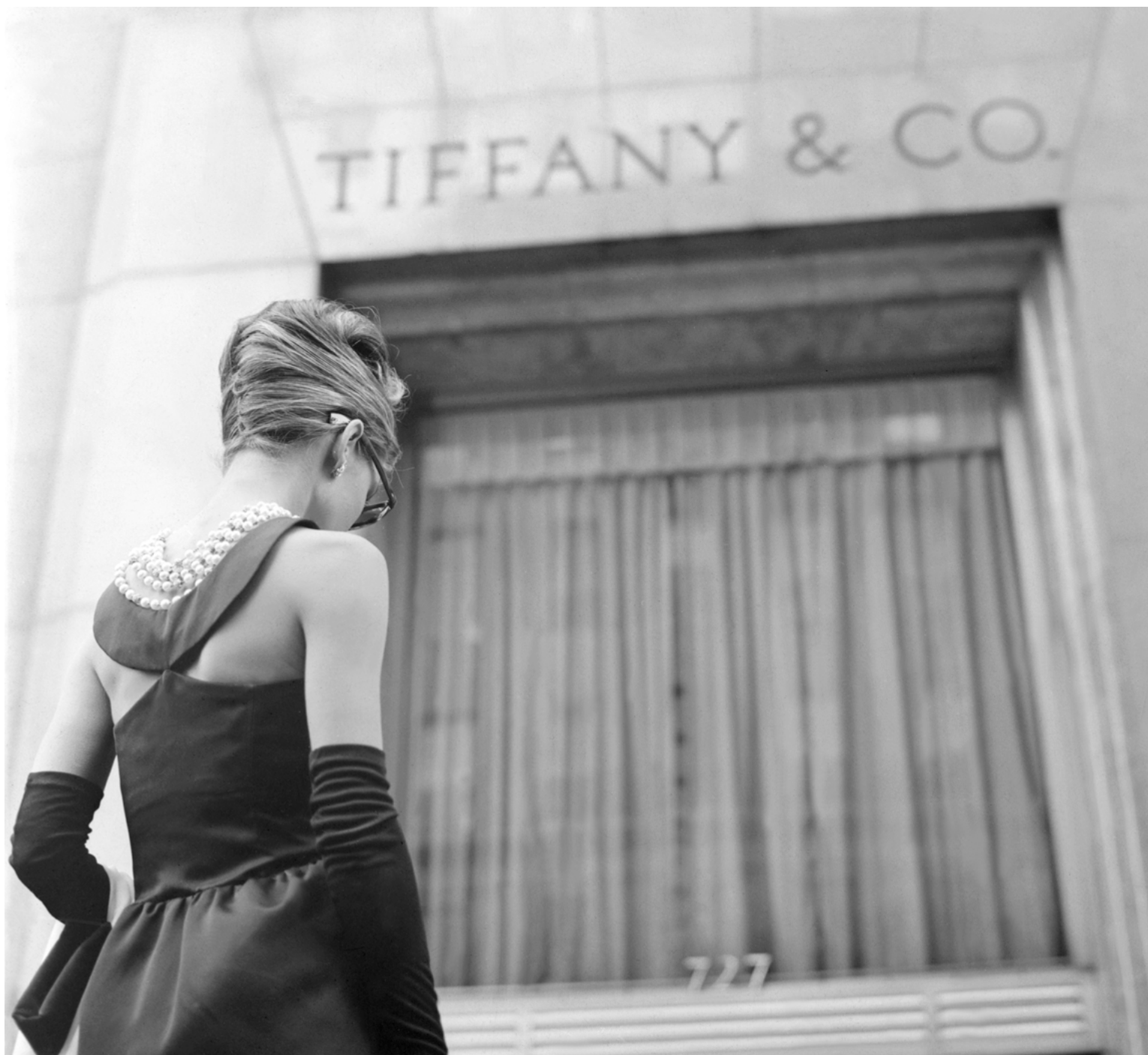
Audrey Hepburn dans Breakfast at Tiffany's , 1961