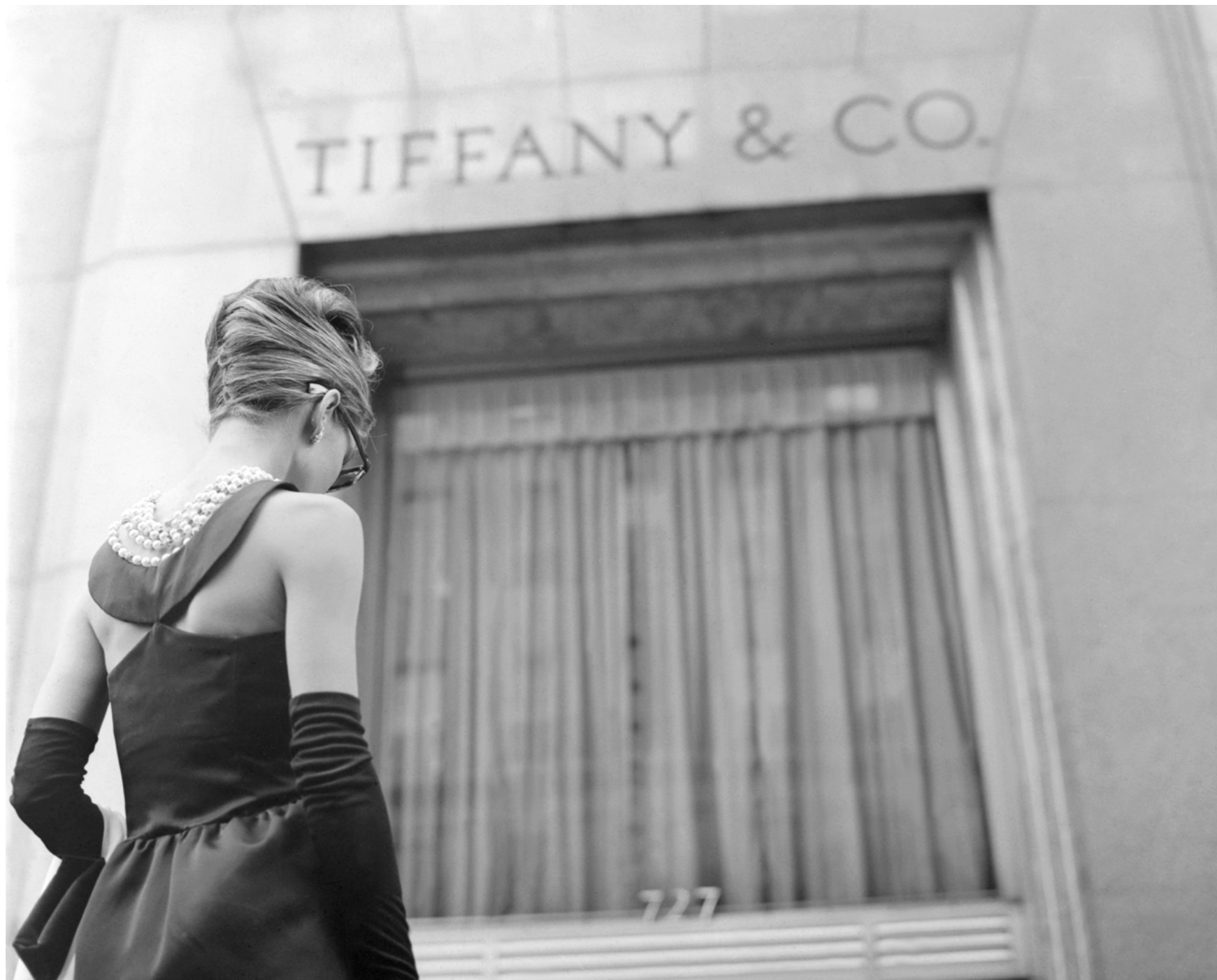
Audrey Hepburn Breakfast at Tiffany's filmean, 1961

Zuten harreman profesionalaz harago, adiskide handiak ziren, elkar miresten zutelako eta sentsibilitate estetiko berak lotzen zituelako. Hepburn diseinatzailearen musa eta haren estiloaren enbaxadorerik agerikoena bilakatu zen. Gainera, Givenchyren lanen xede ziren emakumeak hezurmamitzen zituen, ezin hobeto.