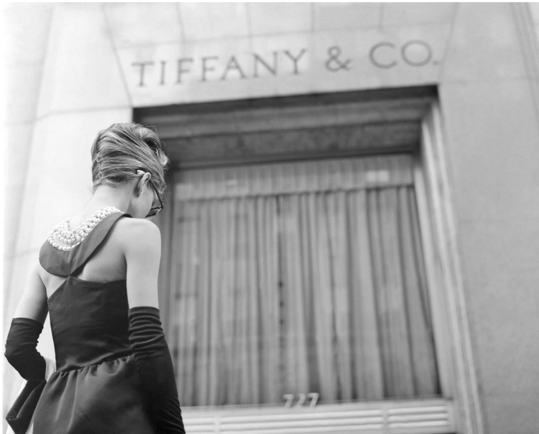
Audrey Hepburn en Desayuno con diamantes , 1961

Más allá de la relación profesional, ambos compartieron una amistad profunda basada en la admiración mutua y en una sensibilidad estética común. Hepburn se convirtió en la musa del diseñador y en la embajadora más visible de su estilo, mientras que Givenchy encontró en ella la encarnación perfecta de la mujer para la que diseñaba.