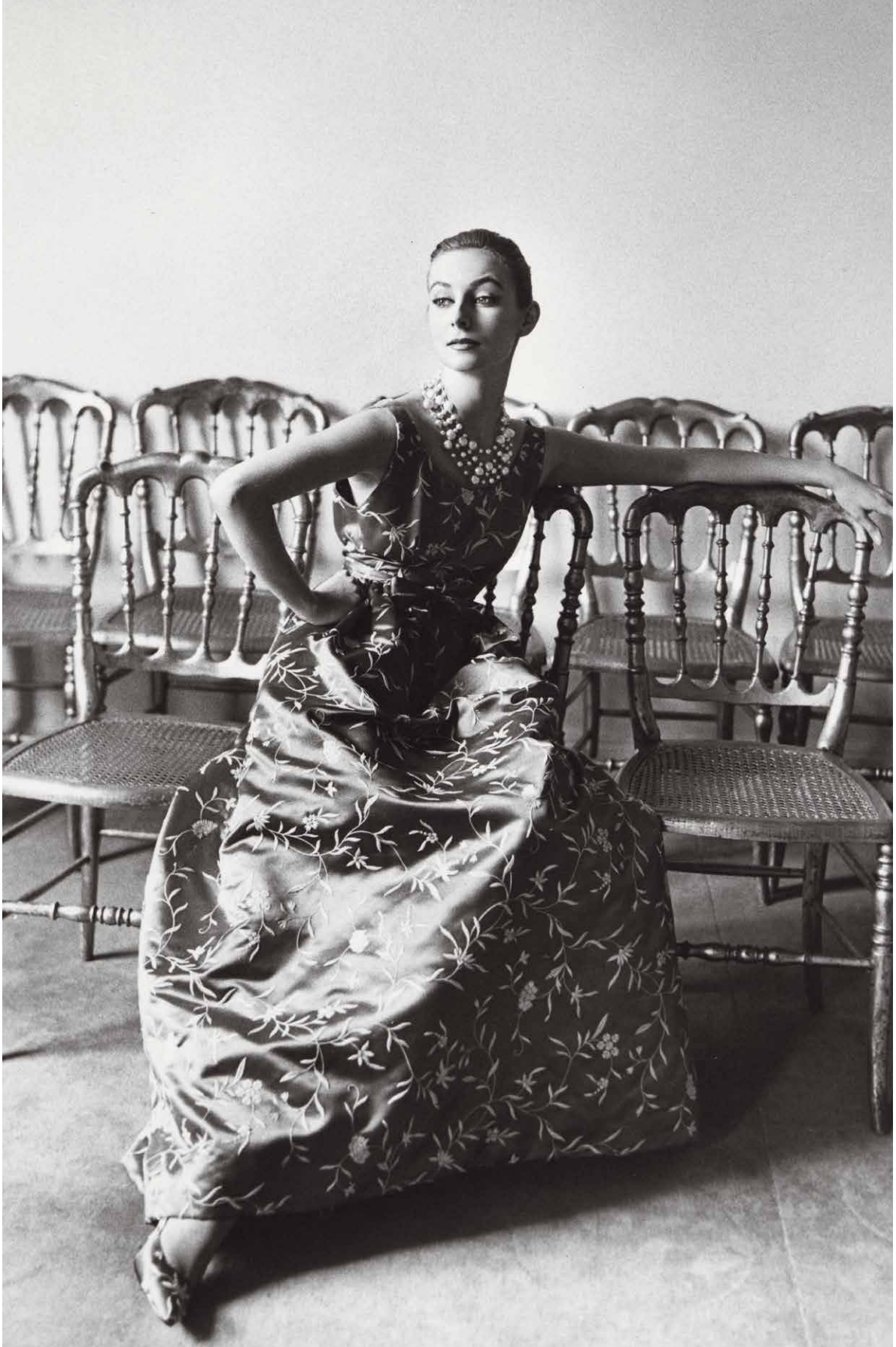
Balenciagaren diseinua Abrahamen zetaz egina. 1958