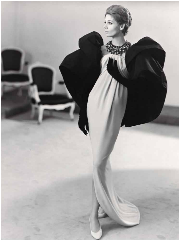
Balenciagaren diseinua Abrahamen zetaz egina. 1961

Bestalde, 1956. urteaz geroztik eredu ohiz kanpokoari jarraitu zioten prentsako argazkiak erakusten dira. Garai hartan, modako aldizkariak hautatu ohi zuten bildumetako zer modelo argitaratu nahi zituzten eta zer argazkilarik egingo zizkien argazkiak; Balenciagak, ordea, publizitatu nahi zituen diseinuen argazkiak bidaltzen zituen prentsara, kasu bereziren batean izan ezik. Tom Kublinek izan zuen argazki haiek egiteko ardura.