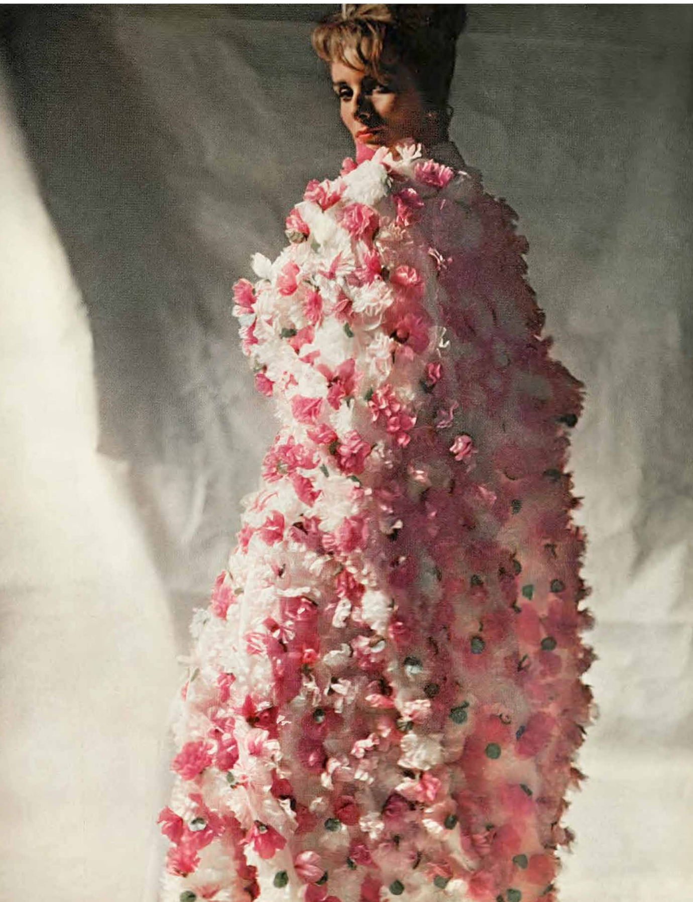
Harper's Bazaar. 1964ko Uztaila