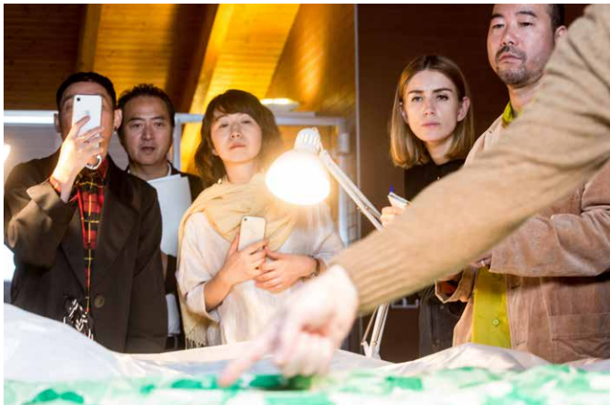
Visita del profesorado al Museo Cristóbal Balenciaga

«El museo tiene en su programa educativo uno de los más potentes instrumentos para transmitir el conocimiento, la técnica y los valores que caracterizaron a Cristóbal Balenciaga. Este proyecto destaca por la capacitación de instructores y profesores, que se convierten en parte fundamental de la difusión de estos contenidos fuera del museo.»