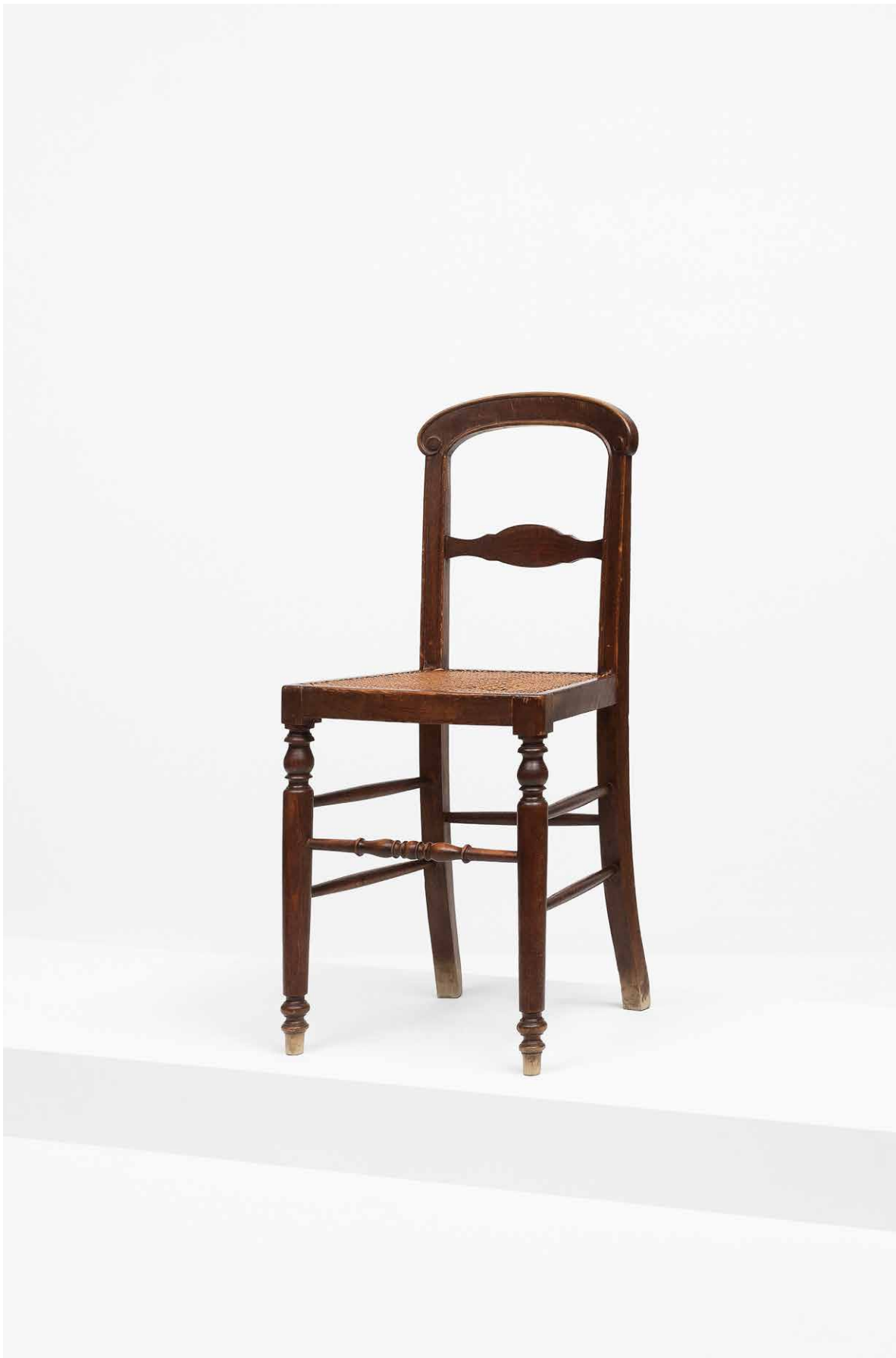
CBM 2000.228 Parisko Avenue Georges v etorbideko 10. zenbakiko lantokiko aulkia