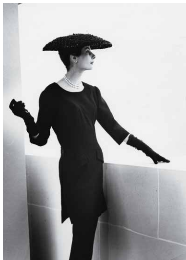
Cristóbal Balenciagaren sorkuntza lanen ondarearen bi lagin: «tunika» eta «midi»

Erakusketaren diskurtsoa 1968an amaitzen da, moda etxea itxi zen urtean, eta orobat egiten dio erreferentzia Balenciaga bizi zela nahiz hura hil ondoren haren obra ondaretzeko gertatutako prozesuari.