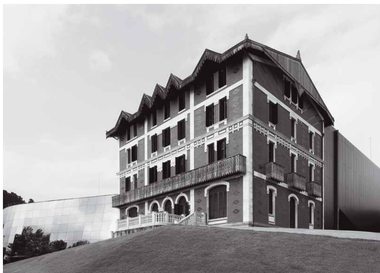
Cristóbal Balenciaga Museoa, Getarian

Cristóbal Balenciaga museoak 2011. urteko ekainaren 7an zabaldu zituen ateak. Jostunaren jaioterrian dago kokatua, Cristóbal Balenciagaren lehenengo prestakuntza-urteen eta heldutasun profesionalaren oroimenez eta modaren munduari egindako ekarpenak ulertzeko helburuarekin.