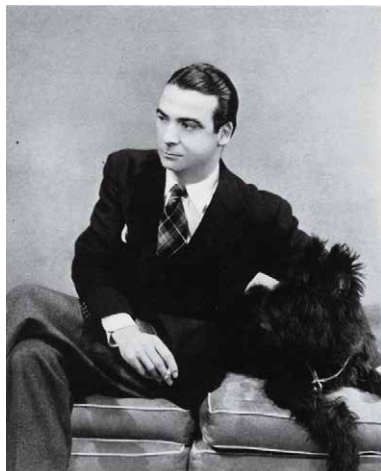
Cristóbal Balenciagaren erretratua