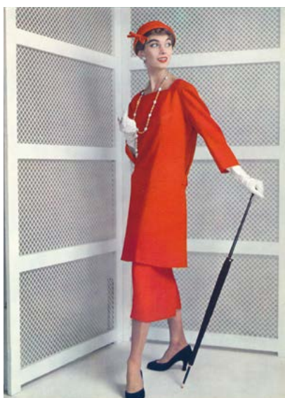
Cristóbal Balenciagaren sorkuntza-lanen ondarearen bi lagin: «midi» eta «tunika».

Bere garaiko moda-kazetarien arabera, Balenciaga izan zen «etorkizuneko modaren bidea ireki zuen jostuna», eta, hain justu ere, bere lana apurka, isilean eta etenik gabe garatuz, ideal femeninoa aldarazi zuen, modu berritzailean, bere bezeroen begietara.