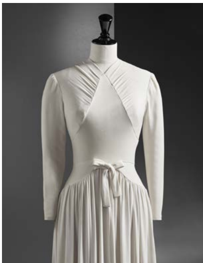
Boli-koloreko krepezko ezkontza-soinekoa, gorputz estuarekin eta aurrean begizta bat duen gerrikoarekin 1939. CBM 2012.06