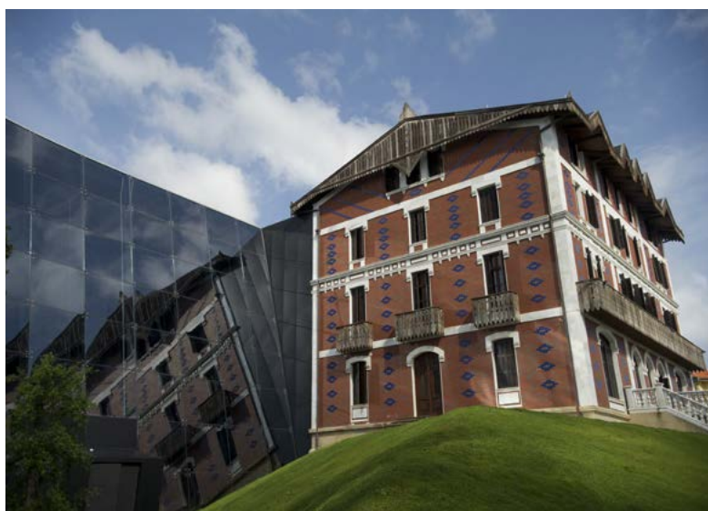
Exterior del Museo Cristóbal Balenciaga en Getaria.

Cristóbal Balenciaga museoa 2011. urteko ekainaren 7an zabaldu zituen ateak. Jostunaren jaioterrian dago kokatua, Cristóbal Balenciagaren lehenengo prestakuntza-urteen eta heldutasun profesionalaren oroimenez eta modaren munduari egindako ekarpenak ulertzeko helburuarekin.