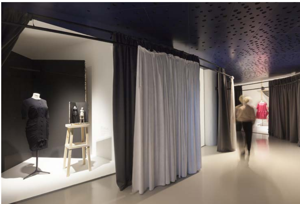
Cristóbal Balenciaga, Moda eta Ondarea.

Horien ondoan, beste baliabide batzuk: dokumentazioa, lekukotasunak, irudiak, objektuak, patrioiak, janzteko erreplikak, zirriborroak, ehunak, haren bizitza- eta lanbide-ingurunearekin harremanetan jartzen gaituztenak. Teknologia ere agertzen da erakusketa honetan, digitalizazioen bidez interaktibitatea errazteko, aukera ematen baitigu pieza baten xehetasuna ikusteko (megapixela), 360°-ko ikuspegia izateko, haren eraikuntza teknikoko infografiak lortzeko eta, app baten bidez, gaikako hainbat ibilbide egiteko.