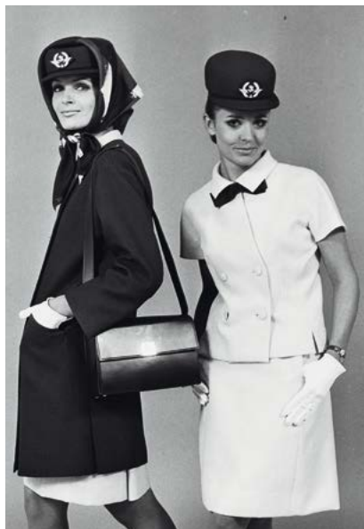
Air franceko hegazki-laguntzaileentzako uniformea, 1968.

Balenciagak "jardunean" jarraitu zuen erretiroan, bere lagunen eta ezagunen prêt-à-porter proiektu batzuetan aholkua eta laguntza emanez, hain zuzen, Villabonako Subijana y Cía (Gipuzkoa) eta Tarazonako Textil (Zaragoza) enpresetan. 1971n, Züricheko Bellerive Museoak atzera begirako lehen erakusketa eskaini zion Balenciagari, eta, haren ondotik, asko izan dira gaurdaino.