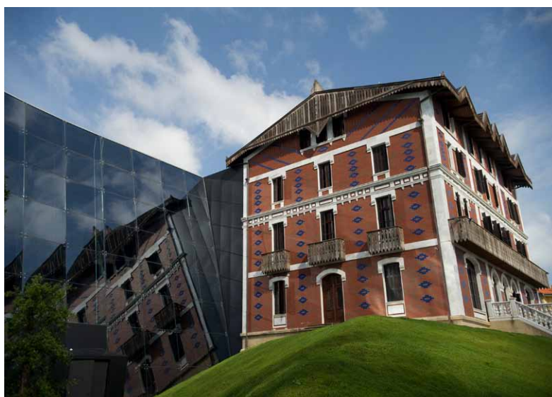
Cristóbal Balenciaga Museoa eta Aldamar jauregia.

Cristóbal Balenciaga museoak 2011. urteko ekainaren 7an zabaldu zituen ateak. Jostunaren jaioterrian dago kokatua, Cristóbal Balenciagaren lehenengo prestakuntza-urteen eta heldutasun profesionalaren oroimenez eta modaren munduari egindako ekarpenak ulertzeko helburuarekin.