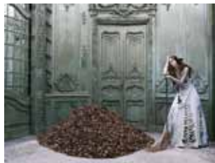
Eugenio Recuenco (1968) Cendrillon , 2005 Impression giclée sur papier coton UltraSmooth FineArt, tirage 2012 43,2 x 56,5 cm Don: Eugenio Recuenco, 2015 MTIB 5.879/15