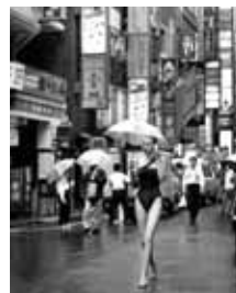
Manuel Outumuro (1949) Tokio, 1995 Impression giclée sur papier FineArt, tirage 2010 50,1 x 40,1 cm Don: Manuel Outumuro, 2010 MTIB 5.629/10