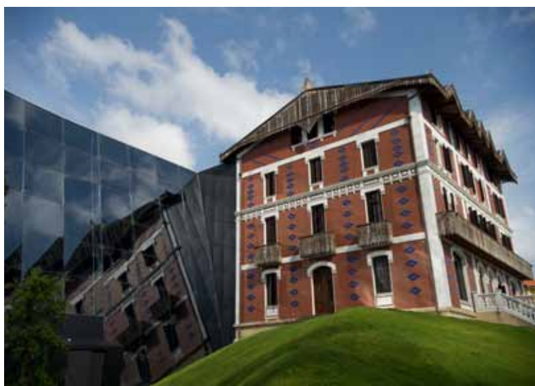
Exterior del Museo Cristóbal Balenciaga en Getaria.

Le musée Cristóbal Balenciaga, inauguré le 7 juin 2011, est situé dans la ville natale du grand couturier, en hommage aux premières années de formation et de développement professionnels de Cristóbal Balenciaga et afin de mieux comprendre ses contributions au monde de la mode.