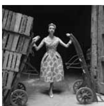
Oriol Maspons (1928-2015) Barcelone, 1956 Robe de Santa Eulalia Gélatino-argentique sur papier baryté, tirage 2012 40,7 x 40,7 cm Don: Oriol Maspons, 2013 MTIB 3.895/15