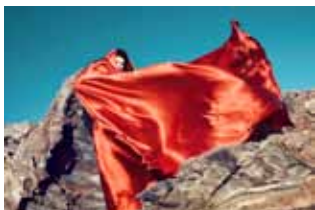
Txema Yeste (1972) Gala Cadaqués, 2009 Impression giclée sur papier Photo Rag Baryta, tirage 2012 47,1 x 70,6 cm Don: Txema Yeste, 2012 MTIB 5.807/12