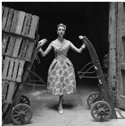
Oriol Maspons, 1956

Vision : déséquilibres volontaires dans la composition, fragmentation, points de vue inhabituels...Leurs photographies furent utilisées pour illustrer des articles et comme publicité par les créateurs de haute couture dans les revues citées, responsables de diffuser la modernité en Espagne.