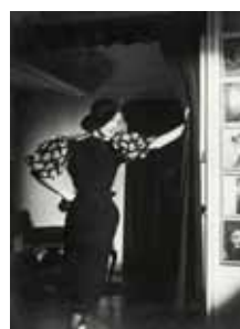
Juan Gyenes (1912-1995) Madril, 1950 Rosina-ren soinekoa Zilar-gelatina paper baritatu, 1950eko inprimaketa MDB2