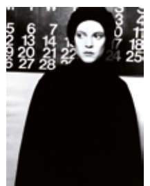
Antoni Bernad (1944) Bartzelona, 1968 Lambda paper baritatu, 2012ko inprimaketa 94,4 x 70,3 cm Dohaintza: Antoni Bernad, 2012 MTIB 3.856/12