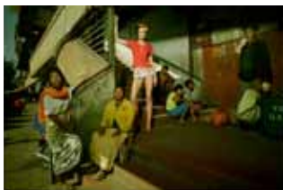
Enric Galceran (1973) Bali, 2006 Giclée Fine Art Baryta paperean, 2015ko inprimaketa 77 x 105,2 cm Dohaintza: Enric Galceran, 2015 MTIB 4.045/13