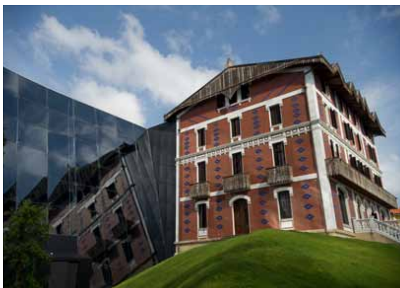
Cristóbal Balenciaga Museoa eta Aldamar jauregia.

Cristóbal Balenciaga museoak 2011. urteko ekainaren 7an zabaldu zituen ateak. Jostunaren jaioterrian dago kokatua, Cristóbal Balenciagaren lehenengo prestakuntza-urteen eta heldutasun profesionalaren oroimenez eta modaren munduari egindako ekarpenak ulertzeko helburuarekin.