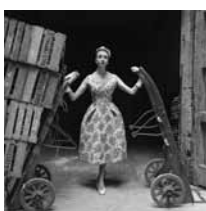
Oriol Maspons (1928-2015) Bartzelona, 1956 VSanta Eulaliaren soinekoa Zilar-gelatina paper baritatu, 2012ko inprimaketa 40,7 x 40,7 cm Dohaintza: Oriol Maspons, 2015 MTIB 3.895/15