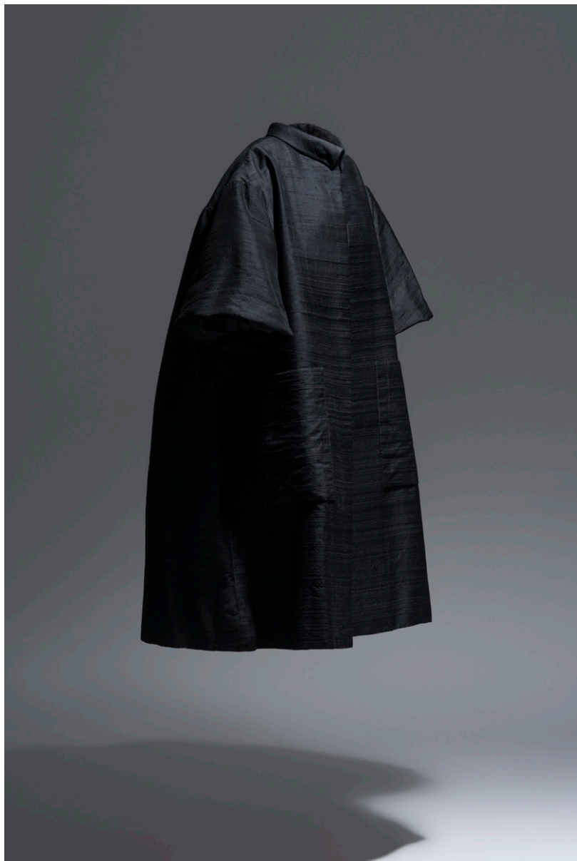
CBM 014.69 Koktel-beroki alderantzikagarria, shantung beltz eta boli-kolorean, 1959

Balenciagaren soinekoek emakumeen gorputzak goreski egiten dituzte toles adimendunen bidez; toles horiek ez dute loturarik bertan bizi diren formekin, eta Chillidaren grabitazioetan gertatzen den bezala, airea inguruan ibiltzea ahalbidetzen dute. Inguratzaileek barne espazio intimo bat eta kanpo espazio publiko bat sortzen dituzte, nondik behatuak diren.