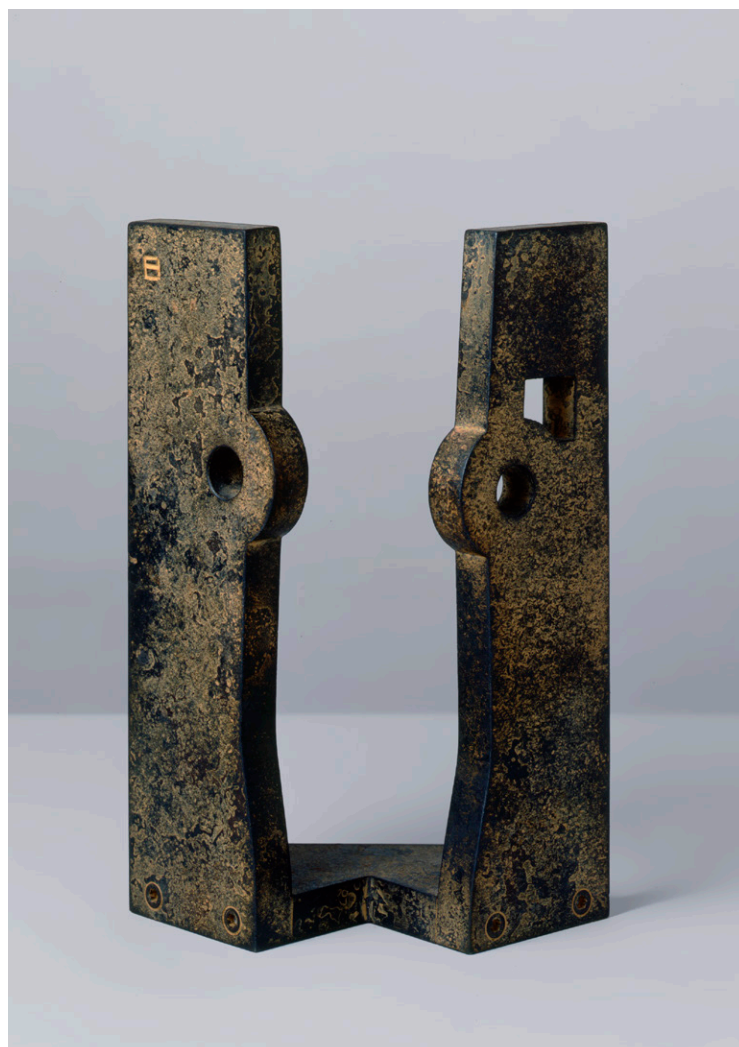
Estudio Homenaje a Balenciaga, 1990 Bilduma pribatua