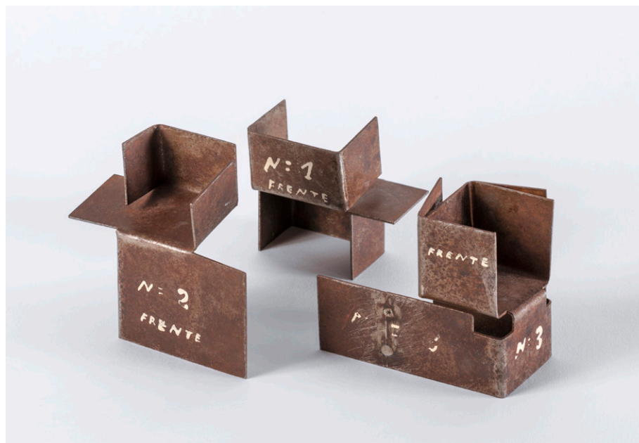
Proyecto para un monumento (Buscando la luz III) , 1990 Noren eskutik Sucesión Eduardo Chillida. Hauser & Wirth

Azkenik, familiei eta haurrei zuzenduta, bi jarduera programatuko dira. Lehenak, Donostiako Orfeoiaekin elkarlanean, eta Europako Musika Egunaren barruan, musika eta sormena uztartuko ditu. Eta bigarrenak, udazken aldean, Maushaus kolektiboaren eskutik, azalpenezko edukian sakonduko du elkarriketen bidez.