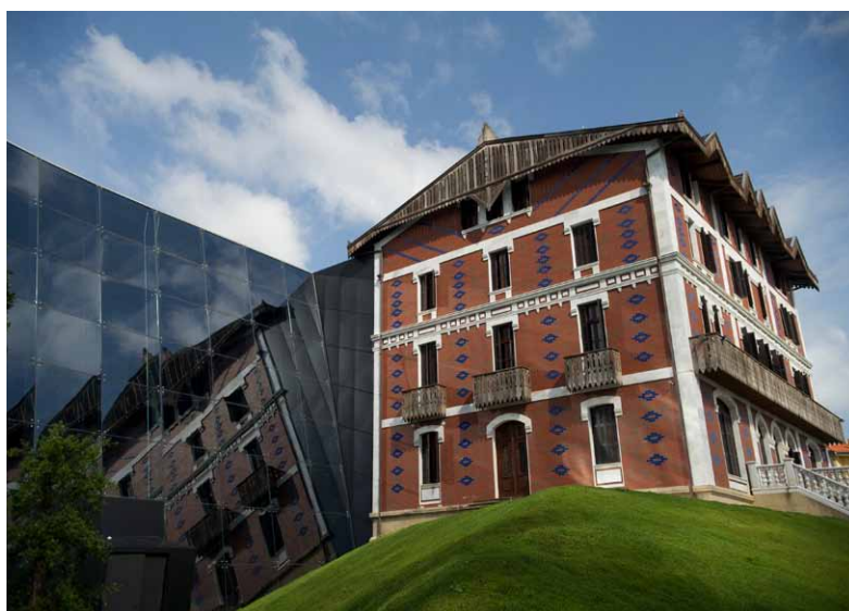
Exterior del Museo Cristóbal Balenciaga en Getaria.

El Museo Cristóbal Balenciaga, inaugurado el 7 de junio de 2011, está situado en la villa natal del modisto, en conmemoración de estos primeros años de formación y maduración profesional de Cristóbal Balenciaga para entender sus aportaciones al mundo de la moda.